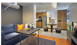
シタディーン スクンビット 11