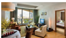
アスコット サトーン