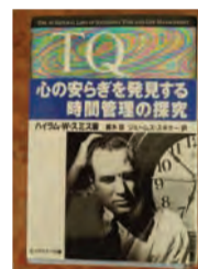
ハイラム・W・スミス著「TQ心の安らぎを発見する時間管理の探究」

翌朝、閃光と雷鳴で目が覚めた。家内も起きてしまったようで、夕べから何回も水を足したのよと言われた。しかし6時を過ぎると、空は青い。雨過天晴、緑も輝きいい気分が一日が始まった。